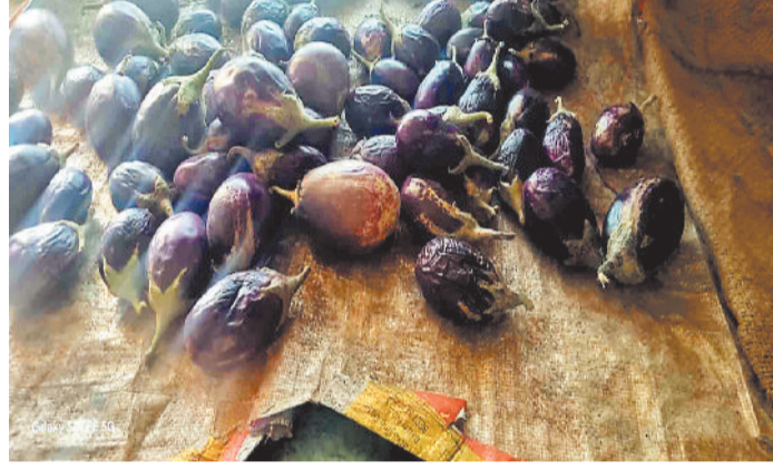
घरसेड़ी स्थित बालक छात्रावास में सड़ी-गली सब्जी व बेसीन में जमा गंदा पानी।