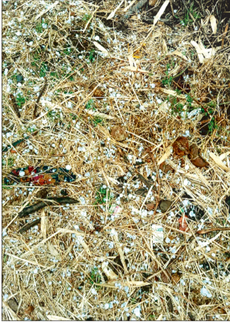
मैनपाट क्षेत्र में गिरे ओले।