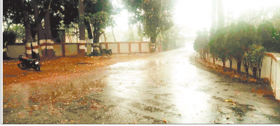
उदयपुर में झमाझम बारिश।