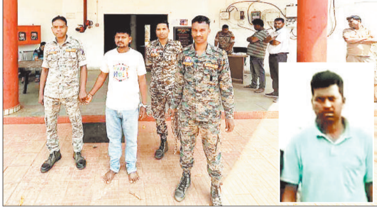
पुलिस गिरफ्तार में सरगना।

बता दें कि बलरामपुर जिले के कुसमी विकासखंड में अफीम की खेती का खुलासा हुआ। तस्करी द्वारा झारखंड के सीमावर्ती क्षेत्रों को अपना सुरक्षित ठिकाना बनाया था और लम्बे समय से अफीम की खेती कर रहे थे। तस्करी बड़े पैमाने पर अफीम निकालकर उसकी तस्करी भी कर चुके थे। खुलासा होने के बाद मौके पर पहुंची पुलिस व प्रशासन की टीम ने त्रिपुरी घोरसांड में 3.67 एकड़ से जड़, ताना, फूल, पत्ती समेत 43.49 क्विंटल अफीम, 1.900 किलोग्राम अफीम का लाला बरामद किया गया जिसकी अनुमानित कीमत 4.75 करोड़ रूपए आंकी गई है। इसके साथ ही खजुरी के तुरीपानी में 1.47 एकड़ खेत से