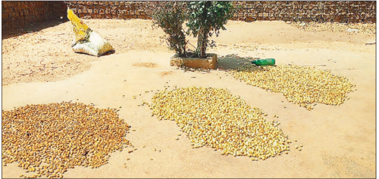
संग्रहित कर रखे गए महुआ फूल।

बैकुण्ठपुर। कोरिया जिले के ग्रामीण क्षेत्रों एवं वन क्षेत्रों में महुआ फूल की महक बिखरने लगी है। ग्रामीण परिवार प्रतिदिन तड़के ही परिवार के सदस्यों के साथ वन क्षेत्रों में पहुंच कर महुआ फूल चुनने के कार्य के लिए निकल पड़ते हैं और दोपहर होने के पूर्व घर पहुंचते हैं। इन दिनों ग्रामीण परिवार खेतों कार्य से फुरसत में हैं और ऐसे समय में महुआ फूल चुनने में जुटे हैं, इससे ग्रामीण परिवारों को अच्छी खासी आमदनी भी प्राप्त करते हैं। जंगलों के अलावा ग्रामीण क्षेत्रों में स्थित महुआ के पेड़ों के नीचे सुबह होने के पूर्व से ही ग्रामीण अपने परिवार के सदस्यों के साथ पहुंचते हैं और घंटों महुआ फूल चुनने के कार्य में व्यस्त रहते हैं। कई ग्रामीण परिवार जिनके